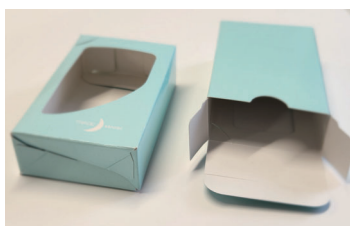
底がロックされて、名刺の飛び出しを防ぎます。